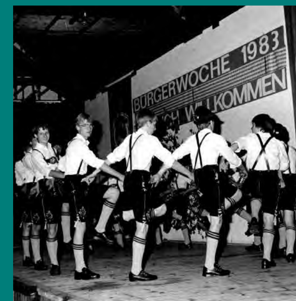
Anfang Juli wird im Zentrum jedes Jahr die Garchinger Bürgerwoche gefeiert, die seit 1972 besteht.