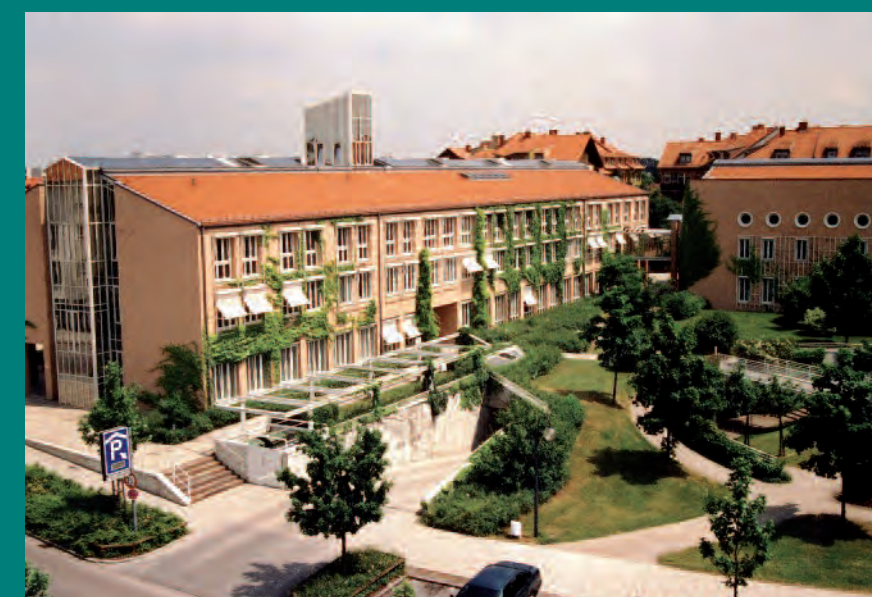
Rathaus Ansicht 1989